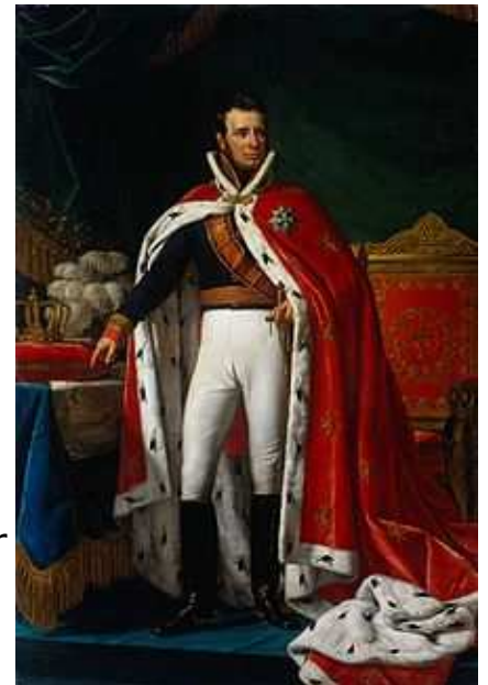
Le roi Guillaume 1er

Le roi, Guillaume 1er, a imposé ses lois. Le roi détient tous les pouvoirs : le pouvoir législatif (faire les lois) et le pouvoir exécutif (faire exécuter les lois). Les hauts postes de l'armée et du politique sont occupés par des Hollandais. Ce qui a comme conséquence que les Belges sont très mécontents.