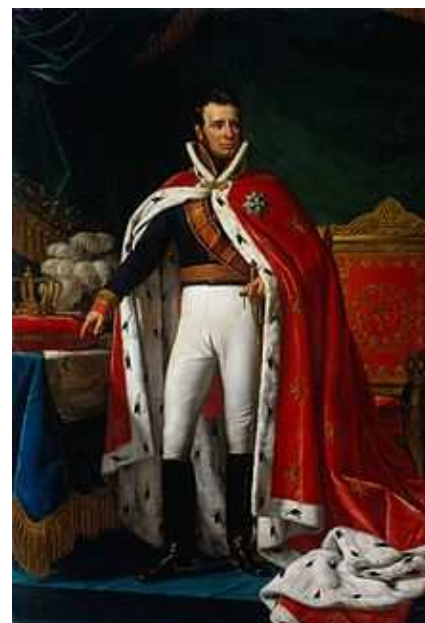
Le roi Guillaume 1er

Le roi, Guillaume 1er, a imposé ses lois. Le roi détenait