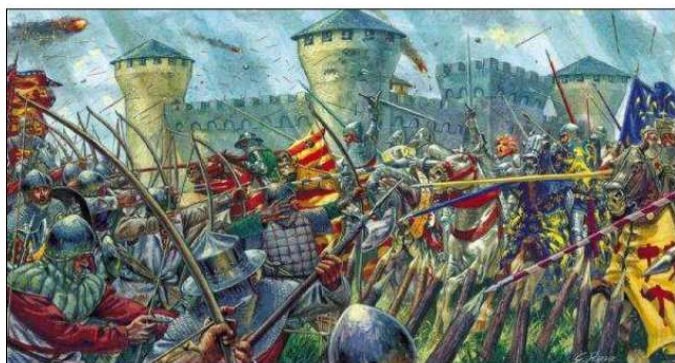
La guerre de 100 ans 1337 –