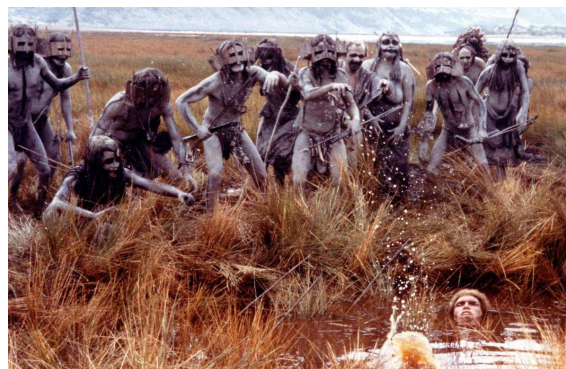
La guerre du feu - 12 000