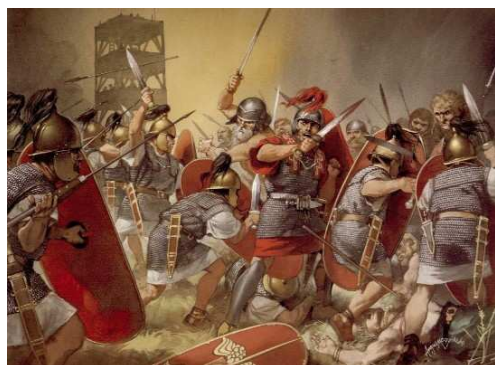
Guerre des Gaules – Jules César 58 à 51 avant Jésus-Christ

Voici des documents qui racontent des grandes guerres connues en Europe. Remplace ces documents sur la ligne du temps. ÉCRIS la lettre du document sur les pointillés sous la période qui convient.